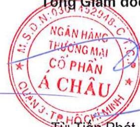
Từ Tiên Phát