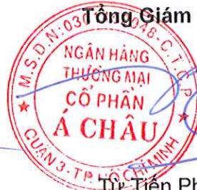
Từ Tiên Phát